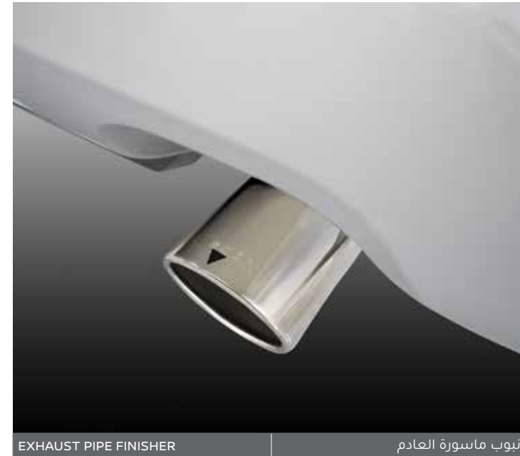
EXHAUST PIPE FINISHER

*أكسسوارات محلية، للشروط والأحكام الخاصة بالضمان، يرجى مراجعة الوكلاء المعتمدين.