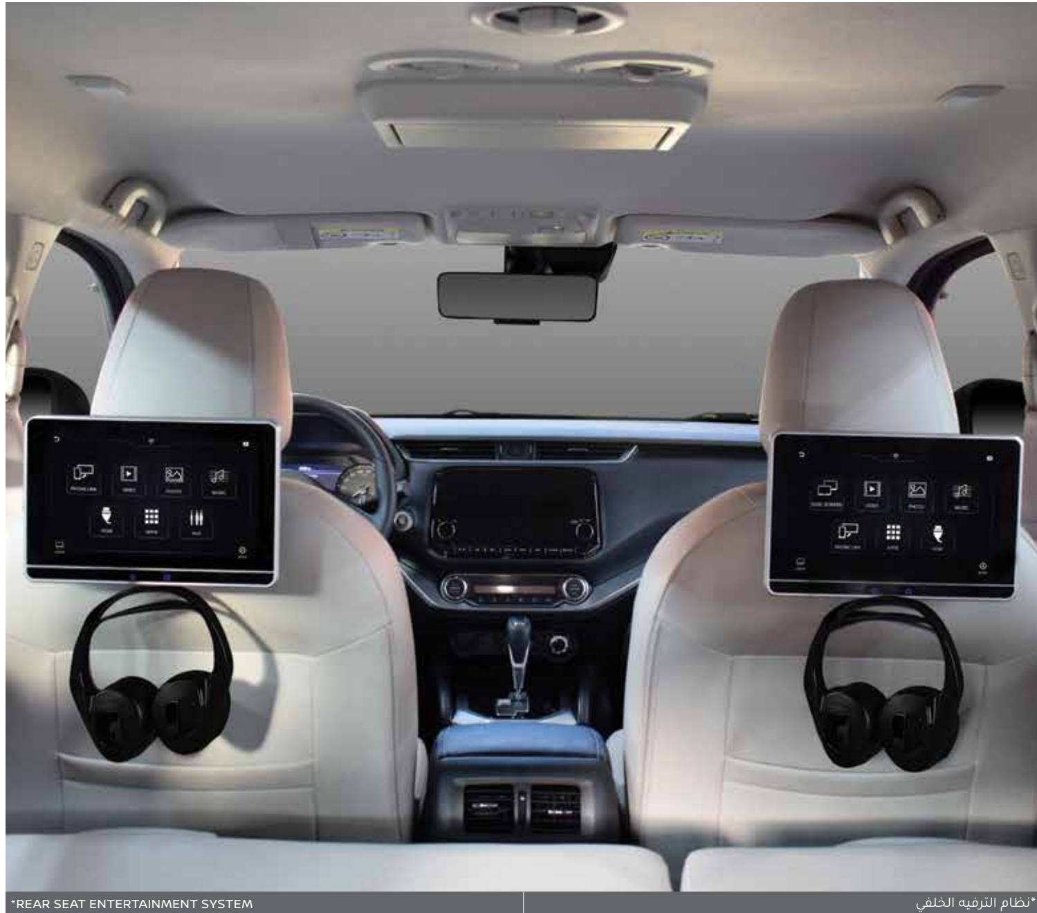
*REAR SEAT ENTERTAINMENT SYSTEM