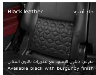
جلد أسود Black leather

متوفرة باللون الأسود مع تطريزات باللون العنابي Available black with burgundy finish