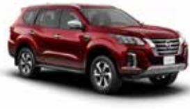
احمر داكن PM (NAW) RED PM (NAW)