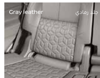
جلد رمادي Gray leather