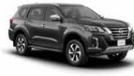
رمادي FPM (K21) GRAY FPM (K21)