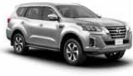
فضي M (K23) SILVER M (K23)