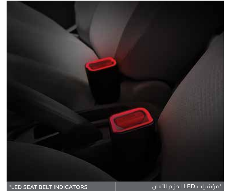
*LED SEAT BELT INDICATORS