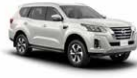
أبيض 3P (QX1) WHITE 3P (QX1)

وتحرص نيسان على التأكد من أن عينات الألوان المعروضة هنا تعكس الألوان الفعلية للسيارة بأقرب درجة ممكنة. وقد يعزى الاختلاف الطفيف في عينات الألوان إلى عملية الطباعة، أو طريقة العرض سواء كانت في ضوء النهار أو الإضاءة الفلورية أو المتوهجة، لذا ننصحك برؤية الألوان الفعلية لدى وكيل البيع.