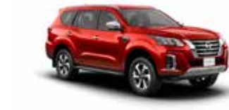
أحمر S (AX6) RED S (AX6)