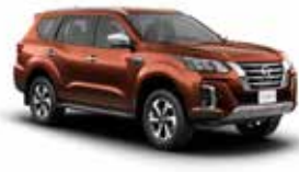
بني PM (CAU) BROWN PM (CAU)