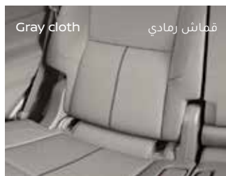
قماش رمادي Gray cloth