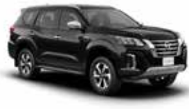
أسود (G42) BLACK (G42)